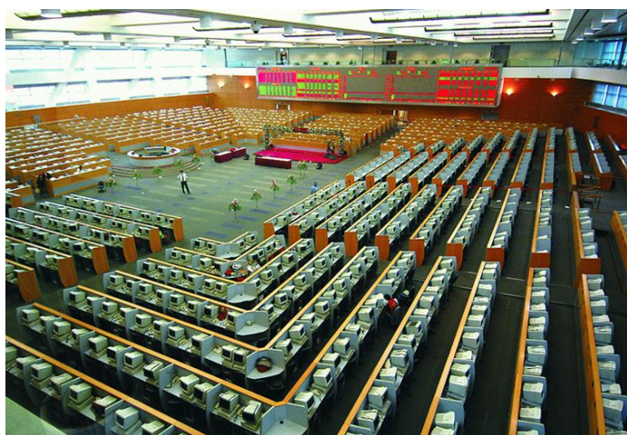
上海証券取引所の取引フロア

2014年11月10日、中国证券监督管理委员会と香港証券監督委員会は共同声明を発表し、同11月17日から「滬港通（香港と上海の証券取引所の相互接続）」システムを正式に開始することを明らかにした。このシステムの活用により、上海と香港の投資家であれば、所在地の証券会社を通じて相手側の証券取引所に上場している株式を購入することができるというメリットがある。中国の資本市場の開放を突破口に、オフショア人民元の取引拡大及び人民元の国際化のステップにしたいという中国政府の思惑がある。 2