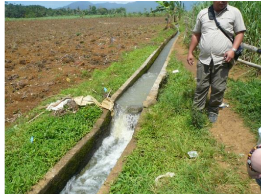
アクア・キューブ設置場所 (Colonia Divina)

本事業は上水道未普及エリアをターゲットとしているが、フィリピンでは上水道普及エリアにおいても、既存の水道管の老朽化などが原因で水道水の水質悪化が問題となっているエリアも多い。こうしたエリアにおいて、「アクア・キューブ」の水道事業への利用や、安全な水の供給が必要な学校や病院での利用など、さまざまは場所での普及可能性が考えられ、フィリピン全体の水問題の解決に大いに貢献し得るものである。