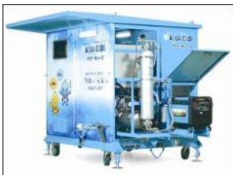
可搬型オールインワンタイプ浄水装置 「アクア・キューブ」(村上製作所製)

本事業は、株式会社村上製作所が製造した、MF膜を利用した浄水装置、貯水タンク、発電機、塩素消毒装置、活性炭吸着塔などをすべて内蔵した可搬型オールインワンタイプの浄水装置である「アクア・キューブ」をフィリピン・ネグロス・オキシデンタル州サガイ市に導入し、「アクア・キューブ」の有効性を実証すると共に、フィリピン国内における同製品の普及を図るものである。